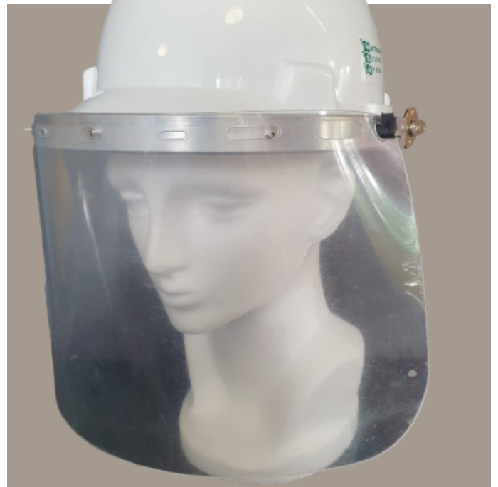
Adaptador Para Casco de Plastico