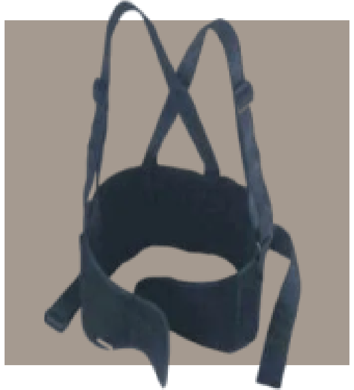
Faja Elástica sacrolumbar