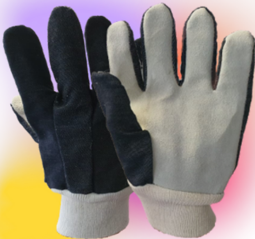
Palma de carnaza y dorso de mezclilla