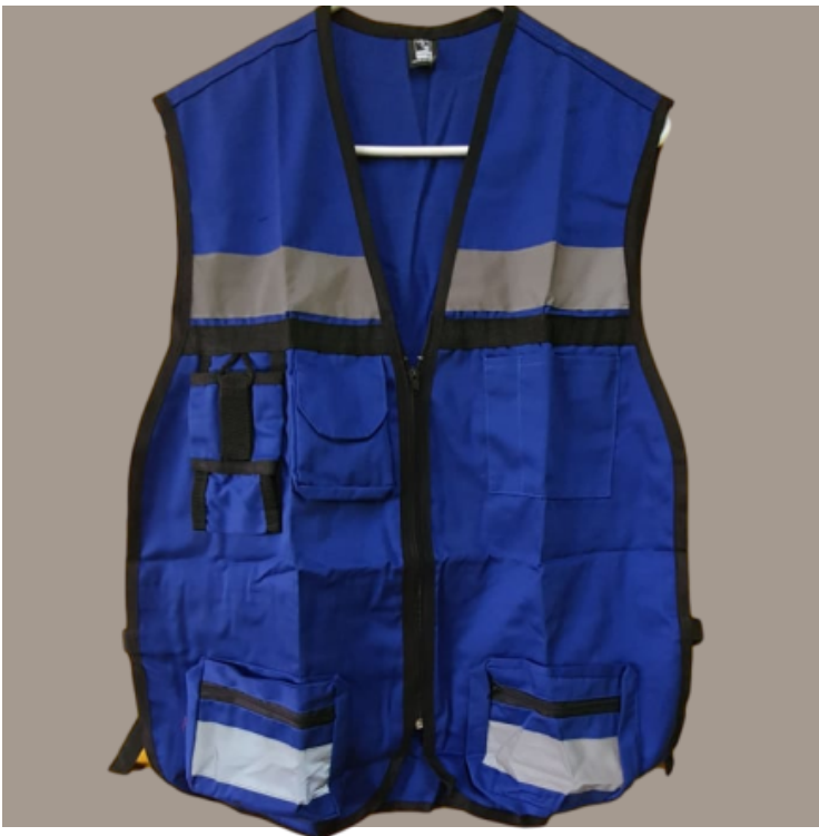
Chaleco tipo Brigadista Azul