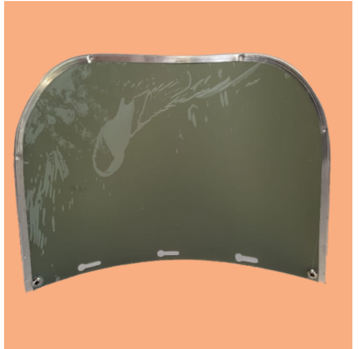
Mica Clara Tipo Universal