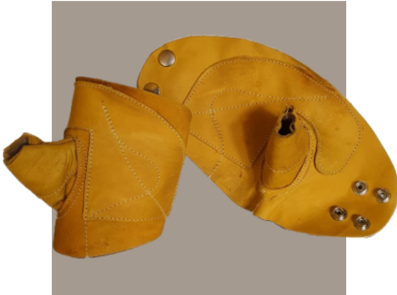
Guante de Amarrador