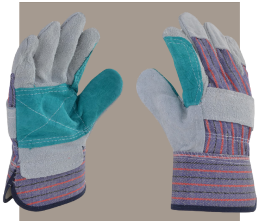
Guante Tipo Mustang