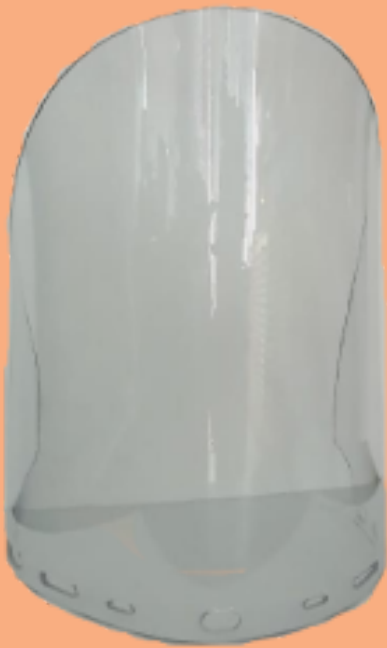
Mica de Policarbonato tipo Hongo