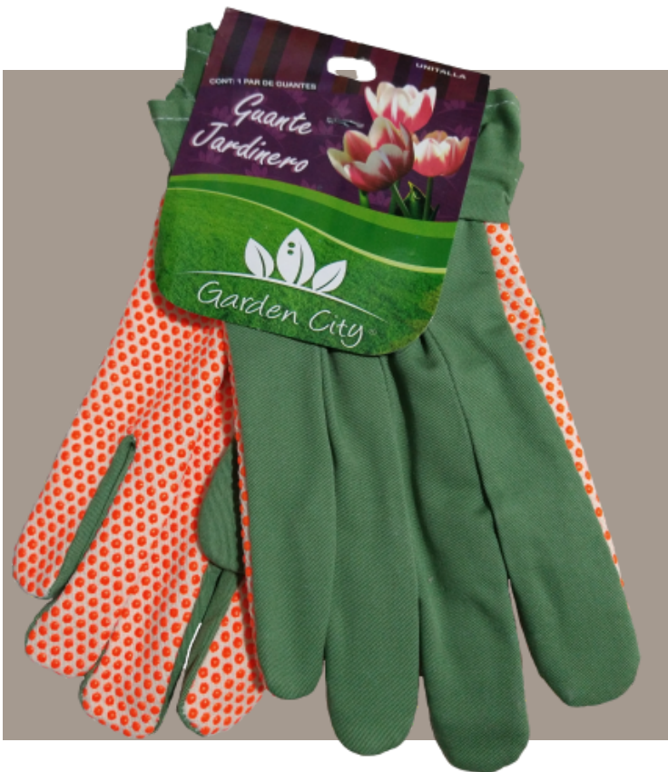
Guante para jardinero