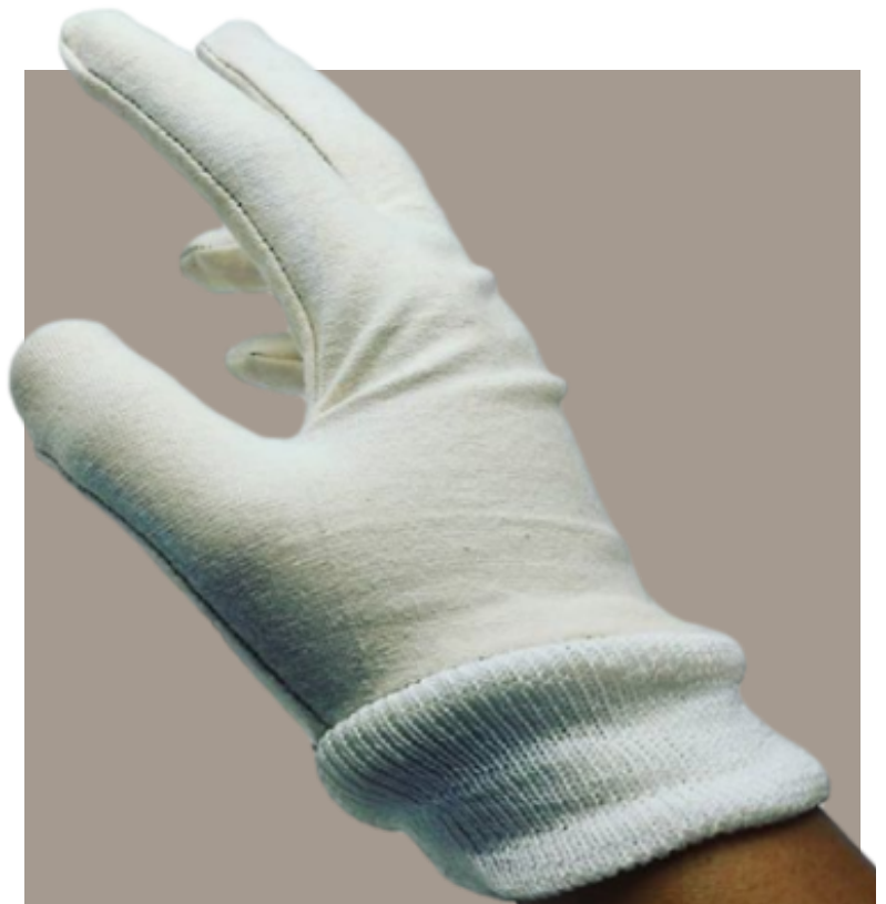
Guante tipo Policia (Damasco)