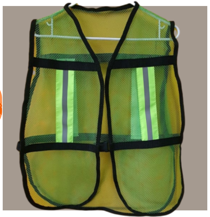
Chaleco de Malla Económico