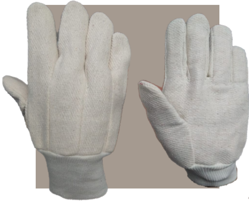
Guante de Lona 2 o 3 palmas