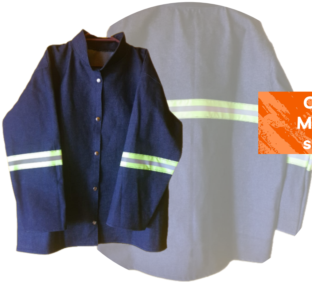
Chamarra de Mezclilla con o sin reflejante