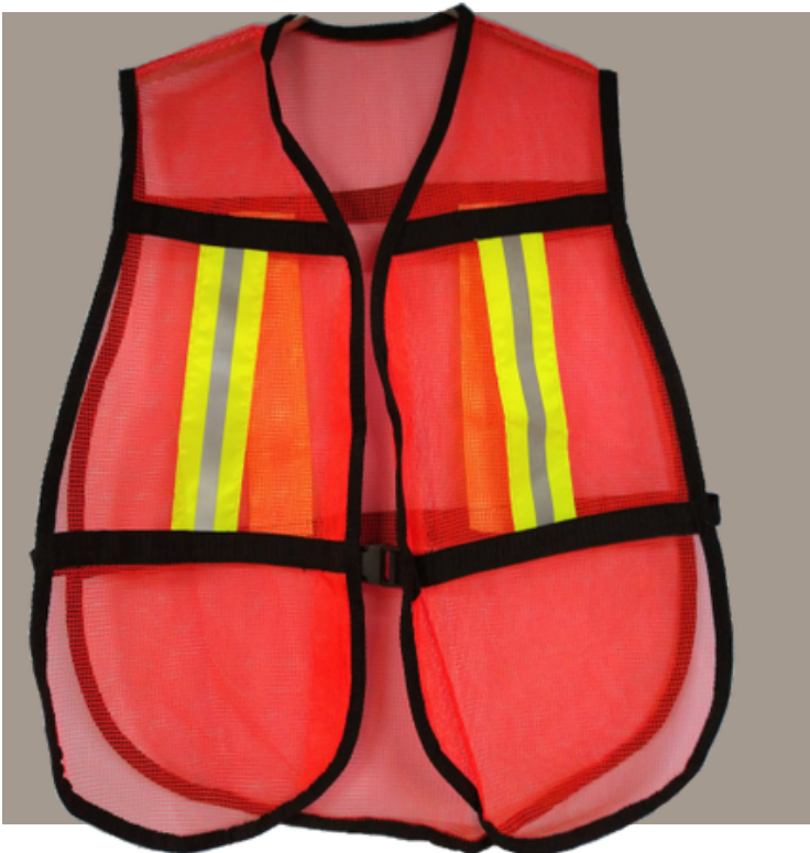
Chaleco de Malla Naranja