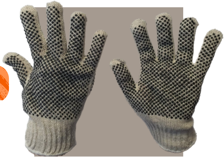
Guante de Toalla