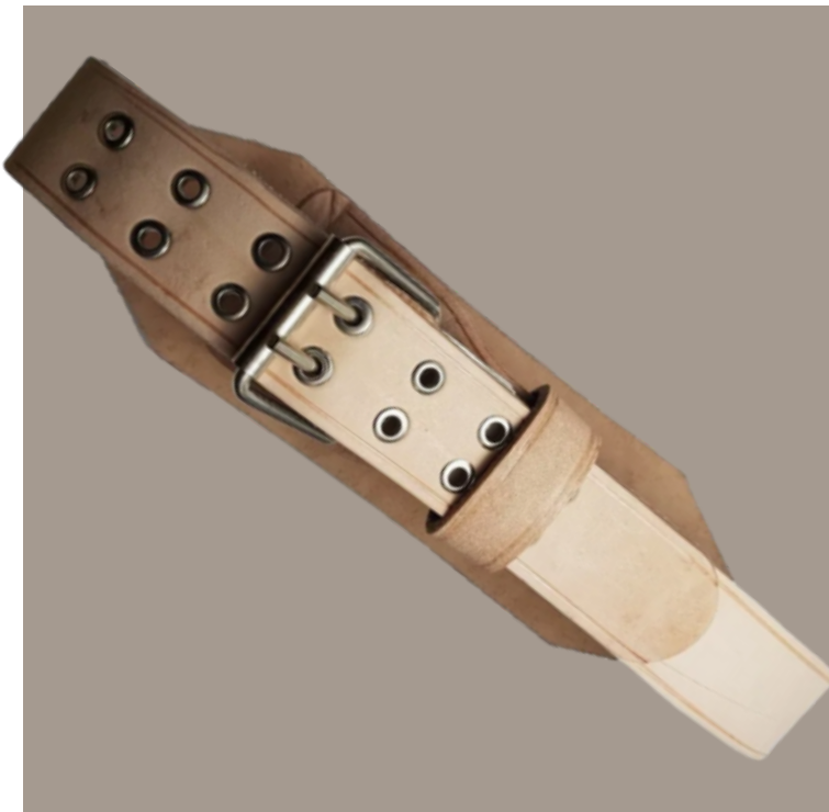
Faja de Cuero